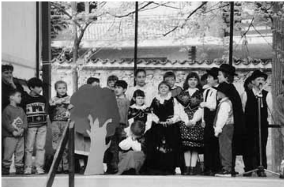
Coazze - 4 mai 1996. Les élèves de Val Soana

Il s'agissait là d'un événement préparé depuis longtemps : en effet, les étudiants, aidés par les professeurs et les experts ont travaillé pendant trois ans, soit chez eux ou auprès des personnes âgées du pays, à la recherche d'anciens objets se rapportant à l'école et à la musique ainsi que d'outils de travail ; ils ont ensuite